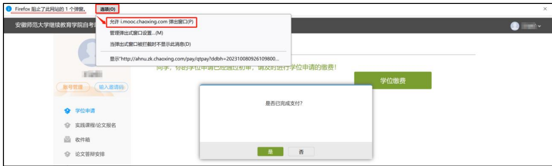
图17 火狐浏览器打开缴费页面