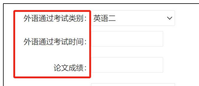
图 9 填写学位外语与毕业论文成绩

(4) 个人信息确认完整无误后，再依次填写通讯地址、邮政编码、联系方式等联系方式；提交毕业论文相关信息；最后上传学位申请审核文件，包括身份证正反面照片、毕业证书照片、毕业论文文件等。完成上传后，再次仔细核对无误后点击【提交】按钮完成申请操作。