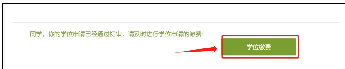
图 13 缴费

(1) 提交申请信息并通过初审的考生，页面提示“同学，您的学位申请已经通过初审，请及时进行学位申请的缴费！”。点击【学位缴费】按钮进入缴费页面。