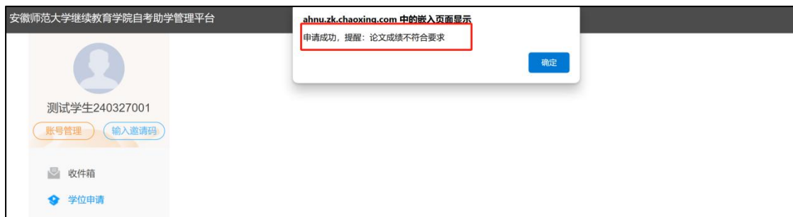
图 11 成绩不合格

(5) 如果学位外语和论文成绩符合学位申请要求，系统会跳转至缴费页面；若不合格，会弹窗提示不合格信息，等待学校人工审核；