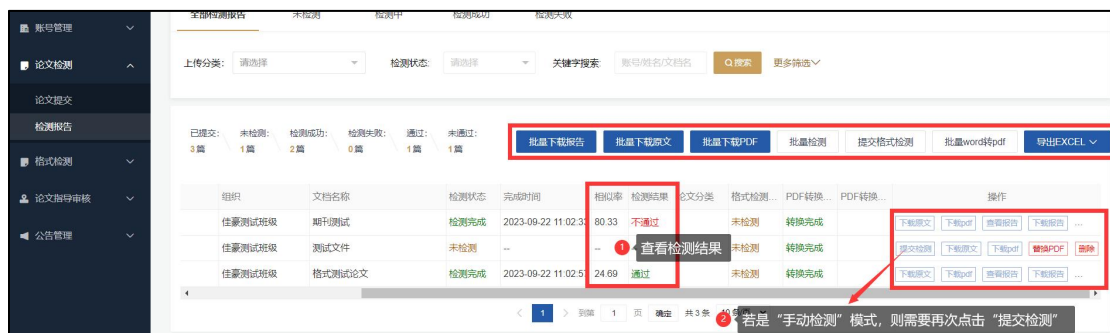
图 2-4 检测报告

学生可在“论文检测”--“检测报告”中查看检测完成或未检测的数据，并支持用户通过多维度检索条件筛选检测数据，以及对原文和检测报告的操作，如下图所示：